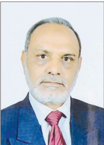
القاضي شافق الشيباني